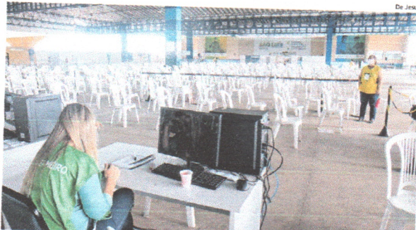
O Centro de Vacinação registrou um pequeno número de pessoas que procuraram doses de vacina

Em pouco mais de uma hora, apenas 20 pessoas foram atendidas. Devido ao movimento baixo, de forma rápida, a pessoa era atendida pelo setor de triagem, que coleta as informações de (a) interessado (a). No CMV, de acordo com a Semus, estão sendo vacinados profissionais de saúde que atuam em setores de urgência e emergência de unidades públicas e privadas incluídas na estrutura de controle epidemiológico da Covid-19.